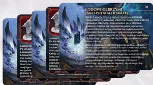
5 KART KONTROLI