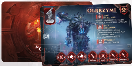
KARTA POTWORÓW – LODOWE OLBRZYMY