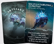
ARTEFAKT POTWORÓW – LODOWE OLBRZYMY