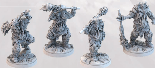
4 FIGURKI LODOWYCH OLBRZYMÓW