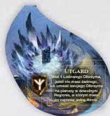
ŻETON DOMENY UTGARDU