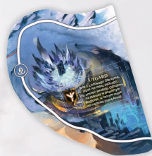
DOMENA DLA 2 GRACZY